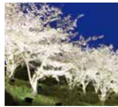
たどつさくらまつり

1500本のソメイヨシノが咲き誇る 県内有数のお花見スポットで開催 されるお祭りです。