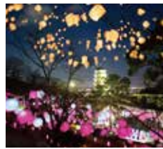
桜たんページェント

多度津のランドマークとも言える 桃陵公園で、おしゃれなマルシェ とスカイランタンイベントを開催。