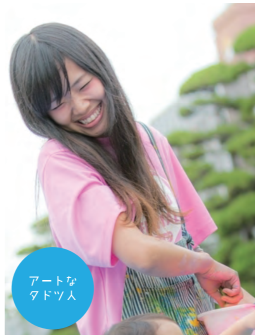
アートな タドツ人