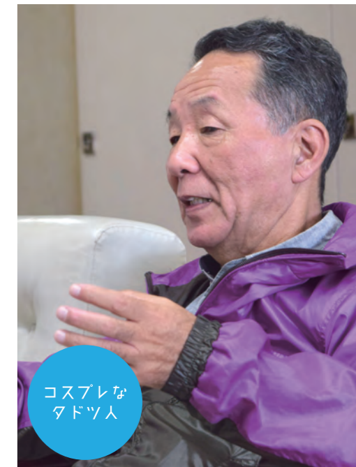
コスプレな タドツ人

タウンプロモーションフリーペーパー たどりつく多度津 #1 フレフレハ、 タドツ人ダ。 ~We are People of Tadotsu~ TAKE FREE