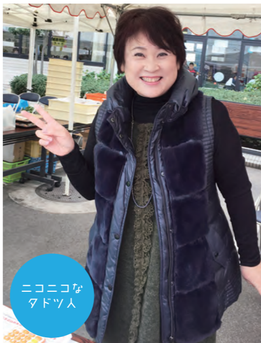
ニコニコな タドツ人