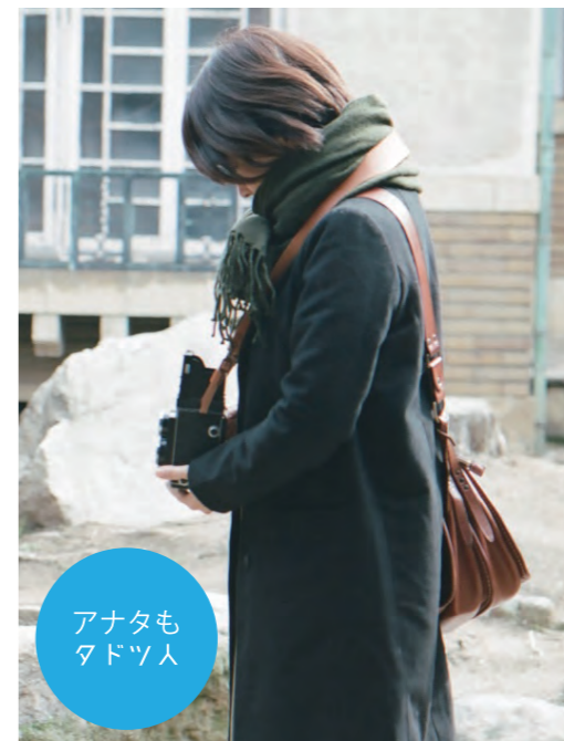
アナタも タドツ人