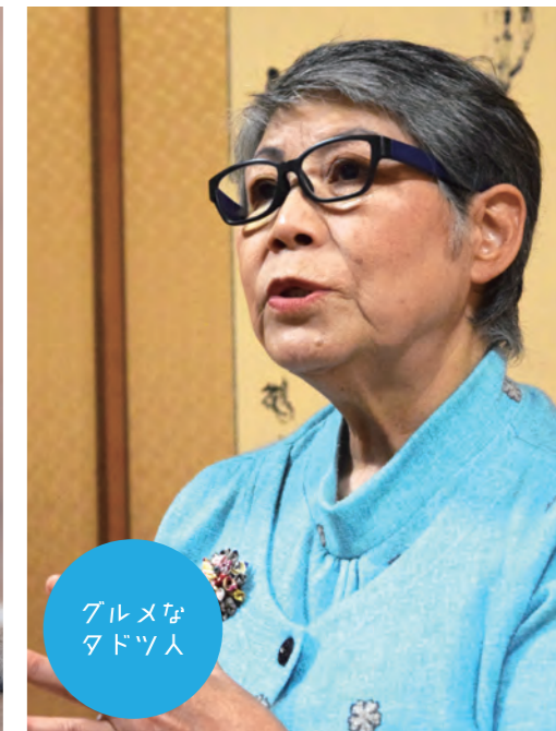
グルメな タドツ人