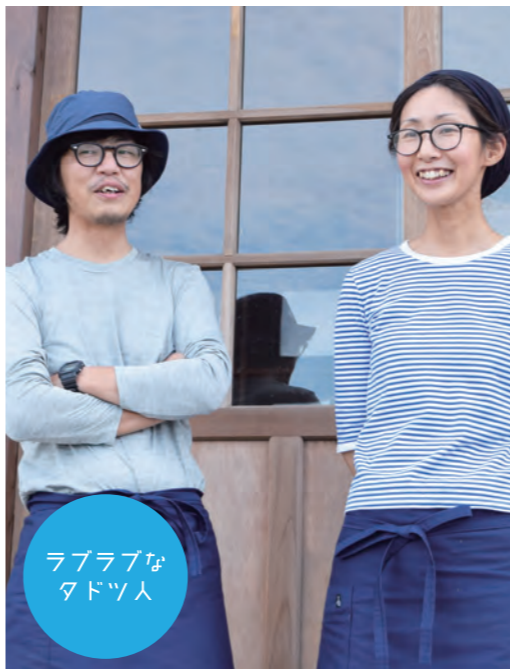
ラブラブな タドツ人

タウンプロモーションフリーペーパー たどりつく多度津 #1 フレフレハ、 タドツ人ダ。 ~We are People of Tadotsu~ TAKE FREE