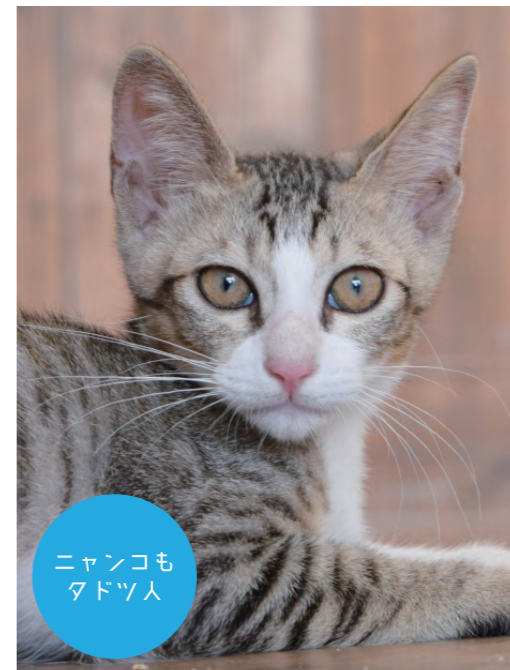
ニャンコも タドツ人