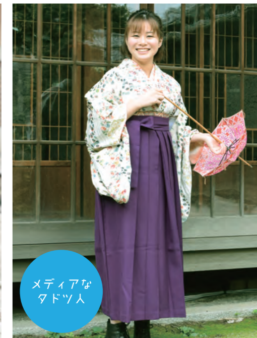
メディアな タドツ人