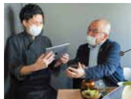
メニューを注文し 50どっつあげると アイスがもらえる！ (ランチ限定)

きめ細やかな脂と旨味が特徴の宮崎産ブランド和牛「安楽牛」を一頭買いし、高品質で良いものをリーズナブルに提供している人気焼肉店。県内で6店舗展開しており、なかでも多度津店は店内の大きな窓から瀬戸内海を一望できるのが特徴！日常から大切な日まで、さまざまなシーンで利用してみてください。