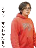
ラッキーマンおかださん