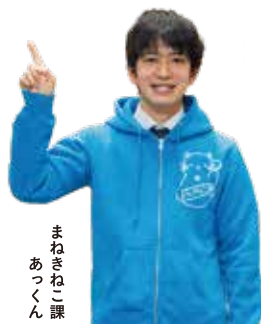
まねぎねこ課 あつくん