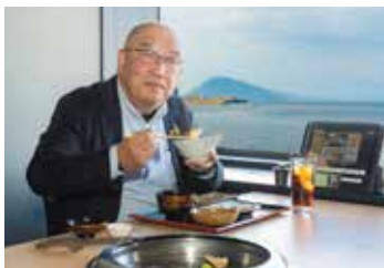
赤身炙り3種盛りランチ(1,408円) サラダ、漬物、ご飯、味噌汁付